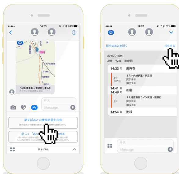
「検索結果を共有」機能の画面イメージ

メッセージの相手に到着予定時刻や自分がどのような経路で向かっているかを知らせることができます。