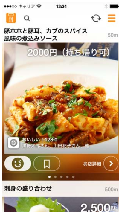
【Chrono】アプリ起動時イメージ

「Chrono(クロノ)」は、アプリを立ち上げるだけで面倒な検索をすることなく、あなたにあった近くの飲食店を瞬時に見つけてくれるアプリです。お店を決めるときに「なんでもいいよ」と言ったことのある決められないあなたにピッタリの飲食店検索アプリの登場です。最新情報のお知らせ等、詳しくは下記キャンペーンサイトをご覧ください。